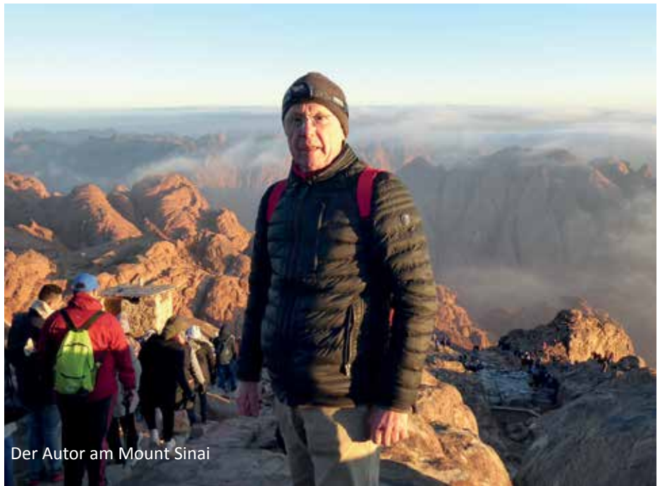
Der Autor am Mount Sinai