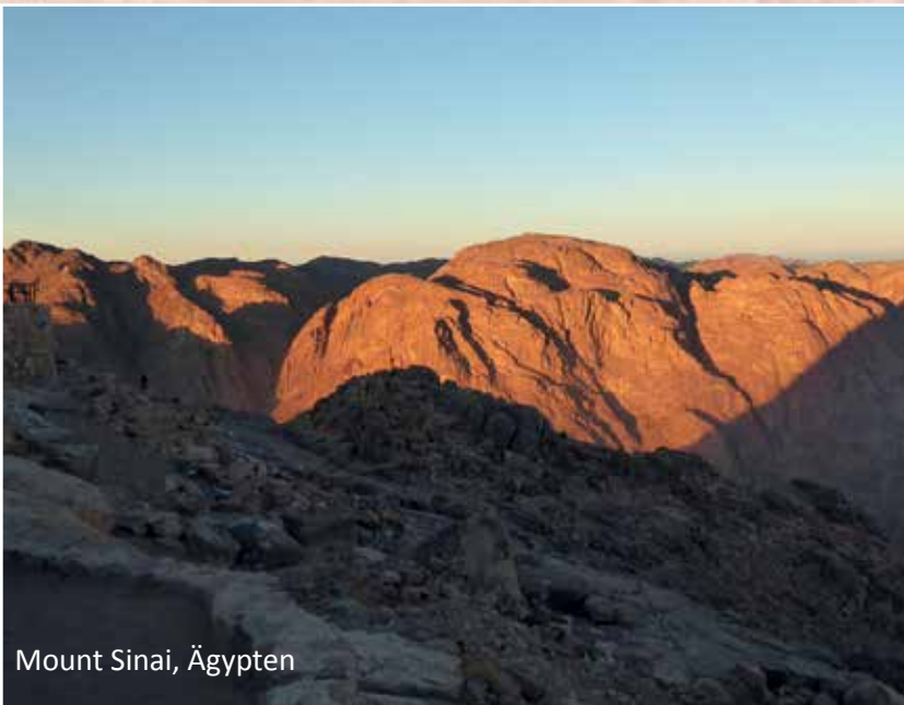
Mount Sinai, Ägypten