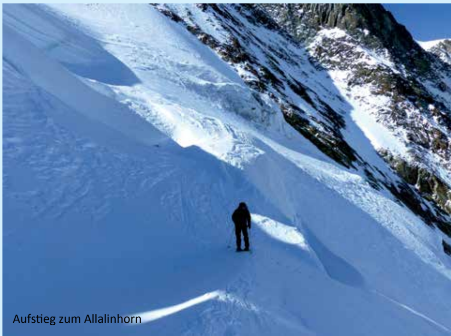
Aufstieg zum Allalinhorn