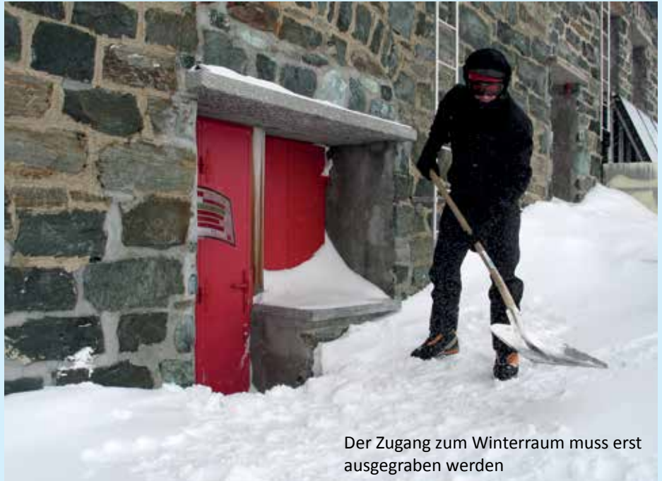
Der Zugang zum Winterraum muss erst ausgegraben werden