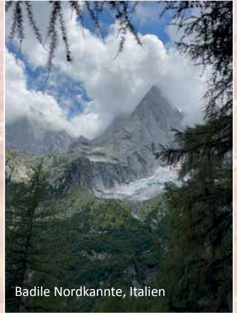
Badile Nordkannte, Italien