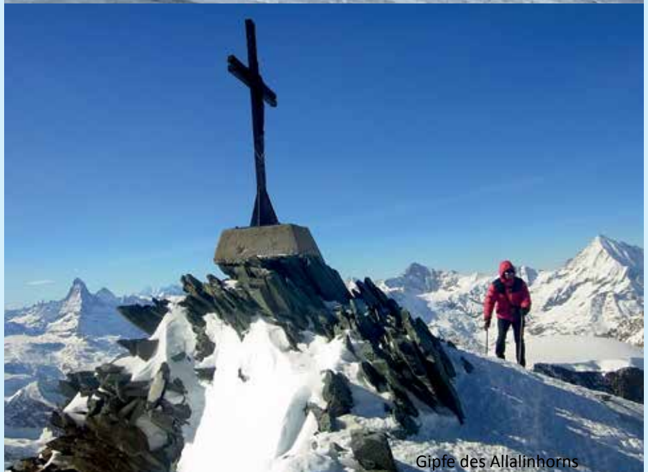
Gipfel des Allalinhorns