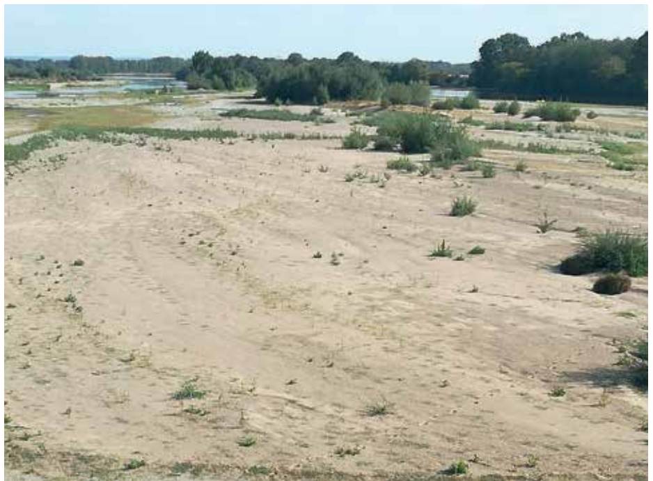
Bild 1 Die Loire kurz nach dem Einstieg Bild 2 Die Rinder weiden Wasserpflanzen Bild 3 Endpunkt – Wüste