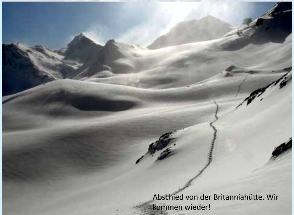
Abschied von der Britanniahütte. Wir kommen wieder!