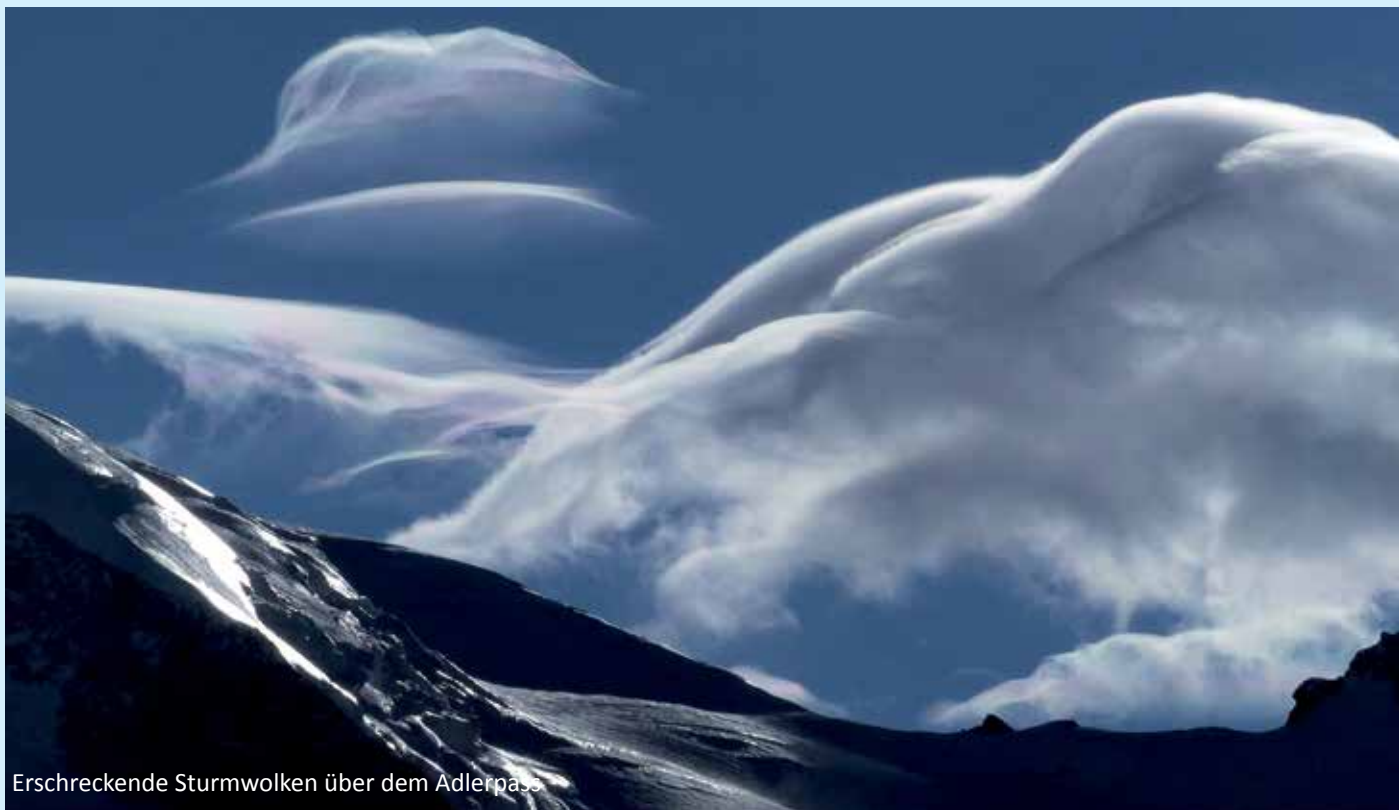
Erschreckende Sturmwolken über dem Adlerpass

überzeugt umzukehren. Unschlüssig machten sie im Sattel Pause. Wir stiegen frohgemut zu unserem Depot zurück und machten erstmal Urlaub. Das Hauptziel „Viertausender im Winter“ war vor der Deadline erfüllt und wir hatten nun alle Zeit der Welt. Die beiden mangelhaft ausgerüsteten Alpinisten waren inzwischen umgekehrt und ebenfalls im Abstieg begriffen; allerdings sehr langsam und der Mann humpelte. Bei der Abfahrt aus dem Sattel hatte es offensichtlich ein Malheur gegeben. Kurze Zeit später schwebte der Rettungshubschrauber ein. Uns erschien dieser Aufwand ziemlich unverhältnismäßig, denn die beiden waren bereits wieder zurück auf der Piste, nur ungefähr 200 m von der Lift-Station entfernt. Wie dem auch sei, die beiden wurden ausgeflogen und wir verbrachten einen angenehmen Abend in der Sonne unterhalb des Allalinhorns.