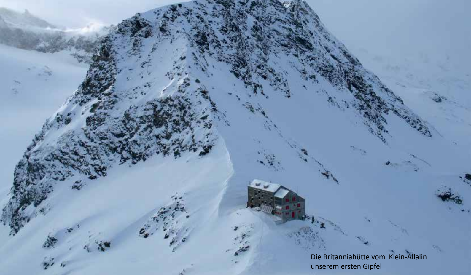
Die Britanniahütte vom Klein-Allalin unserem ersten Gipfel

den Plan B eintreten lassen. Auf uns warteten bis zum Abend 1200 Höhenmeter. Als Zwischenziel zur Britanniahütte hatten wir uns die Jausenstation Morenia auserkoren. Auf den zahlreichen Pisten war wegen des frühen Termins und des schlechten Wetters kaum jemand unterwegs. Alle paar Minuten schossen Skifahrer aus dem Dunst, der inzwischen aufgezogen war und verschwanden geräuschlos genauso unvermittelt wieder im Nebel. Sie störten uns überhaupt nicht. Wir hielten uns unmittelbar am Rand der vorbildlich planierten Strecken und versuchten aus den verschiedenen Wegweisern schlau zu werden. Den Aufstieg über die schwarzen Pisten 6a und 7 vermieden wir, denn das sah zu sehr nach Kletterei aus. Völlig unklar, wie man sowas runterfahren konnte. Unser Respekt vor Skifahrern wuchs, allerdings konnten wir auch niemand ausmachen, der die schwarzen Pisten hinunterstürzte. Vielleicht kommen die Wahnsinnigen später im Jahr. Wir wählten rot und das war immer noch steil genug. Die angekündigte Jausenstation entpuppte sich als riesige Selbstbedienungskneipe mit geringer Frequenzierung, augenscheinlich wegen des schlechten Wetters. Draußen standen die Skier und Snowboards mustergültig aufgereiht und wir platzierten unsere Rucksäcke mit den Schneeschuhen und Lawinenschaufeln dazwischen. Wir waren die einzigen mit solch einer Ausrüstung. Inzwischen hatten wir so viel Geld bei Zügen und Liften eingespart, dass wir uns