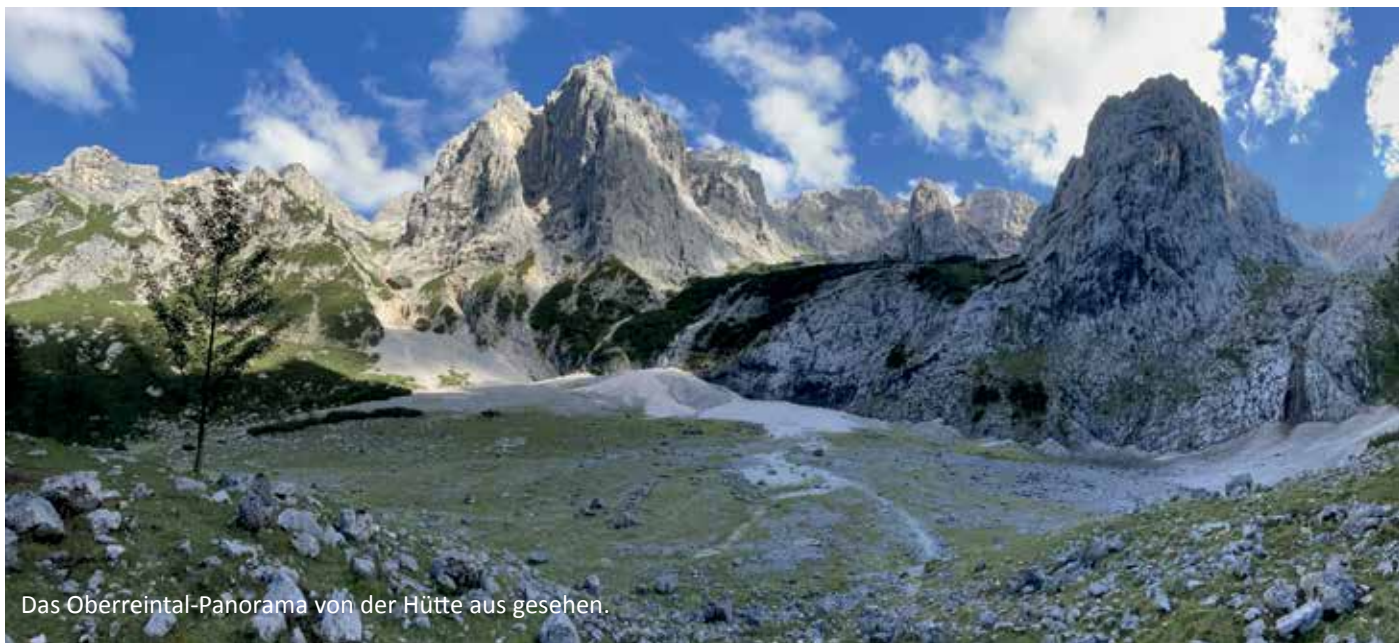
Das Oberreintal-Panorama von der Hütte aus gesehen.

lange Touren gemacht habe? Weil die Anreise nicht ganz so lang ist? Weil das Oberreintal seit jeher der heilige Hain der Kletterer ist und mit genialen Touren aufwartet? Ich weiß es nicht mehr. Jedenfalls stand er irgendwann auf der Liste. Verglichen mit dem Badile sind die Eckdaten ähnlich. Etwas mehr Kletterlänge und die obligatorischen Schwierigkeiten einen halben Grad geringer zieht er sich über 1000 Höhenmeter gewunden aus dem Oberreintal bis hinauf zum 2360 m hohen Westgipfel der Partenkirchener Dreitorspitze.