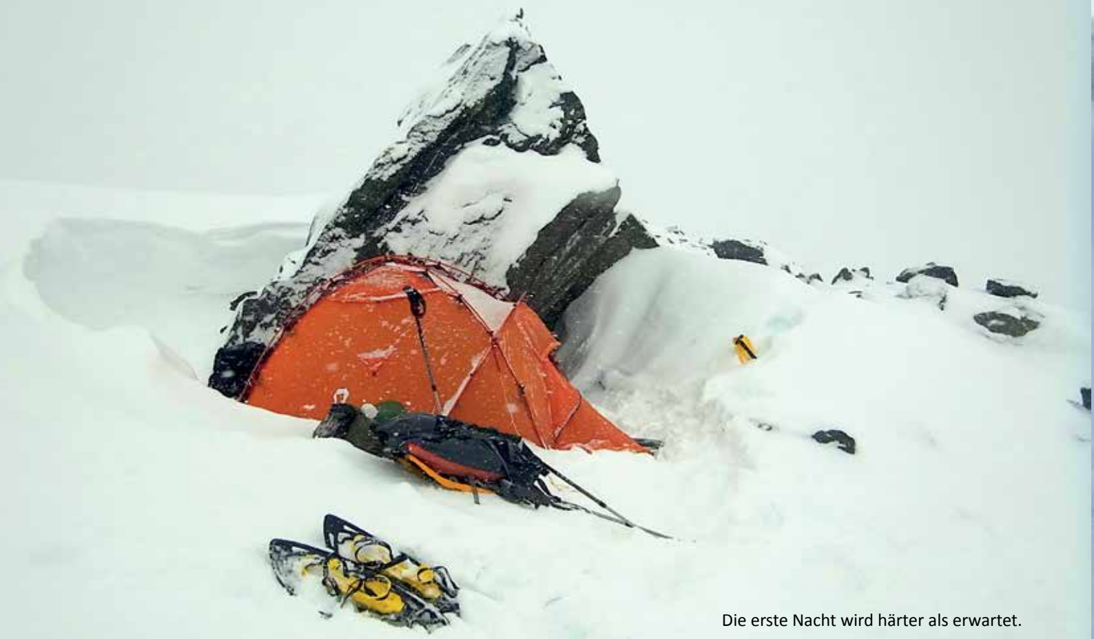
Die erste Nacht wird härter als erwartet.

Wir wollten die Zeit im Februar nutzen, bevor die Skitouren-Saison so richtig startet. Man kann das gut an den Öffnungszeiten der Berghütten ablesen. Bis März haben die meisten SAC-Hütten geschlossen, nur die Winterräume sind geöffnet. Nach kurzer Diskussion, ob wir uns auf den Aletschgletscher wagen oder die Walliser Alpen unsicher machen sollten, einigten wir uns auf Saas Fee. Zum einen, da wir dort schon unterwegs waren und mehrere leichte Gipfelziele ausgemacht hatten. Zum anderen lockte die gute Erschließung. Ungespurte Hänge kosten viel Zeit und vor Lawinen hatten wir einen Heidenrespekt. Der Kessel oberhalb von Saas Fee ist von unzähligen Skipisten durchzogen und damit der gelangweilte Pistenfahrer leichter dazwischen wechseln kann, gibt es ebenso zahlreiche Querverbindungen. Der Pistenplan gleicht einem Spinnennetz, welches uns den Ein- und Aufstieg erleichtern sollte. Allerdings hatte uns der Ski-Zirkus von Saas Fee vor ein paar Jahren bei einer Besteigung des Alphubels im Sommer fast in den Wahnsinn getrieben. Beim Überqueren der hier besonders zahlreichen Gletscherspalten und sogar auf dem Gipfel wurde man mit Techno-Musik beschallt. Der Hohlspiegel, den die Wände von Dom und Lenzspitze bilden, verstärkte diese noch, was bei einer nötigen Spaltenbergung besonders unangenehm war. Eine Verständigung mit dem Opfer der instabilen Schneebrücke war fast unmöglich. Deshalb hatten wir