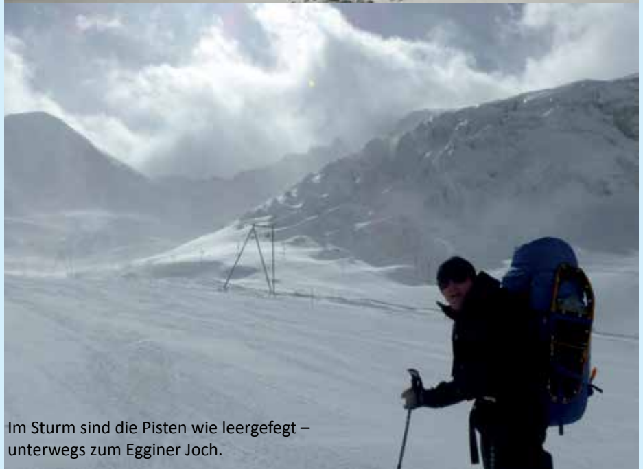
Im Sturm sind die Pisten wie leergefegt – unterwegs zum Egginer Joch.