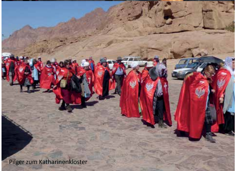
Pilger zum Katharinenkloster