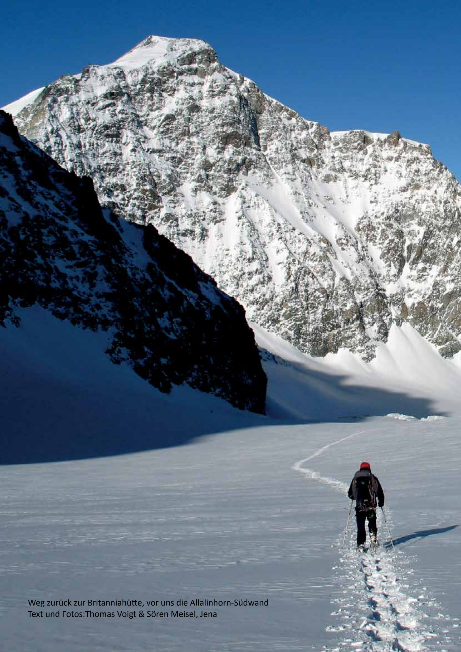
Weg zurück zur Britanniahütte, vor uns die Allalinhorn-Südwand