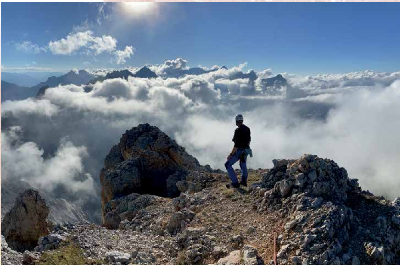
Noch zwei Fotos zum Artikel von Frank Gassmann: Oli am Gipfel der Dreitorspitze mit Blick Richtung Zugspitzmassiv und Abstieg von der Meilerhütte, das Zugspitzmassiv in der Morgensonne