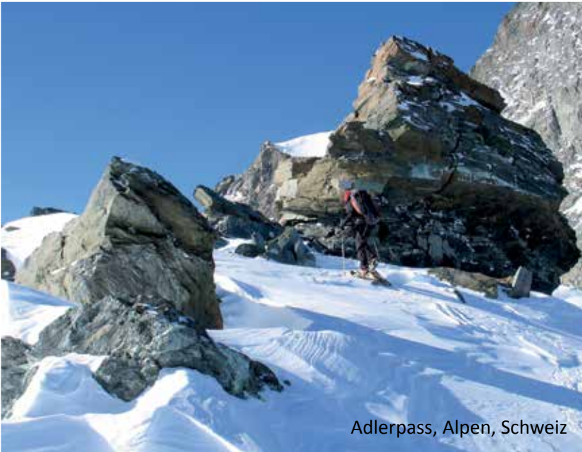
Adlerpass, Alpen, Schweiz