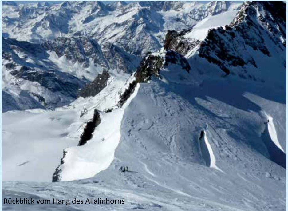
Rückblick vom Hang des Allalinhorns

den Ausblick zum Matterhorn ein. Nach Norden hatte man den spitzen Grat des Feechopfs und die symmetrische Gipfelkuppe des Alphubels vor sich, daneben die „Schweizer Mistgabel“: Täschhorn, Dom und Lenzspitze. Südlich, fast zum Greifen nah, das Rimpfischhorn und das Strahlhorn, unsere potentiell nächsten Ziele. Sie glänzten stark in der Sonne, was für harten Firn oder Eis sprach. Indessen erreichten die ersten einheimischen Skitourengeher den Gipfel und wir fotografierten uns gegenseitig. Wir ernteten Anerkennung, denn der klassische Stil und unser Zelt am Fuß des Berges waren nicht unbemerkt geblieben. Später kam noch ein Pärchen hinzu, das sich ausgesprochen ungeschickt anstellte. Sie hatten keine Steigeisen dabei, wollten aber trotzdem unbedingt auf den Berg! Von den Tourengehern wurden sie energisch